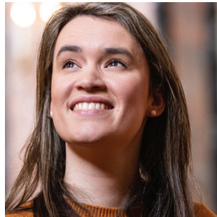
Figure de l'Orchestra of the Age of Enlightenment, la mezzo-soprano Helen Charlston remporte en 2018 le premier prix de la Handel Singing Competition et termine finaliste du Concours international de chant du Grange Festival, avant d'être désignée Rising Stars de Classic FM en 2022. En 2021, elle intègre Le Jardin des Voix, l'académie pour jeunes chanteurs